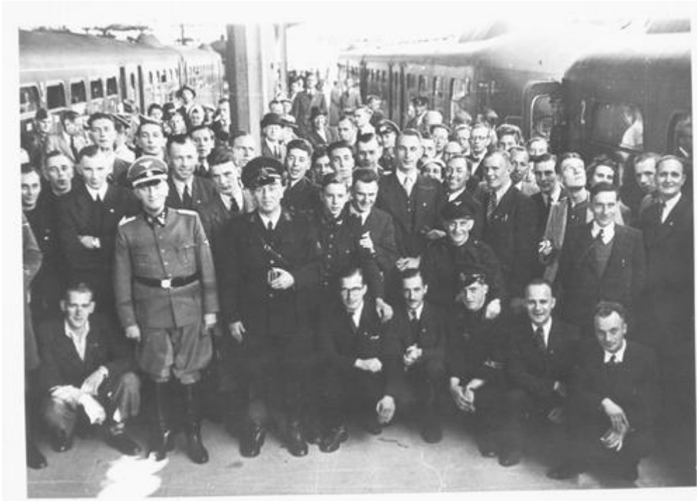
Afbeelding. 'Vertrek van de Eerste Zug van de P.K.[Propaganda-Kompanien] vanuit Den Haag.' Beeldbank WO2 . Publiek domein.

Tijden van oorlog en conflict leveren gevoelige beelden op. Bijvoorbeeld foto's of opnames van personen met een NSB-verleden of andere collaboratie-activiteiten in de Tweede Wereldoorlog. Deze kunnen veelvuldig voorkomen in archiefcollecties. Dit beperkt zich niet alleen tot overheidsarchieven als het Centraal Archief Bijzondere Rechtspleging, maar dit type materiaal komt ook in familie-, verenigings- en bedrijfsarchieven vaak voor.