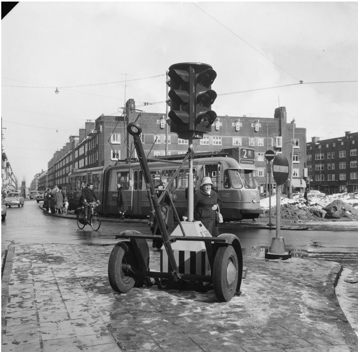
Afbeelding. Hoofddorplein met radiografisch stoplicht

Alleen wanneer deze stoplichten allemaal op groen staan, kan het document juridisch gezien rechtmatig beschikbaar gemaakt worden. Hierbij is het belangrijk, dat een kopie beschikbaar stellen op internet gezien wordt als een vereenvoudiging van dat document onder de auteurswet. Ook is het beschikbaar