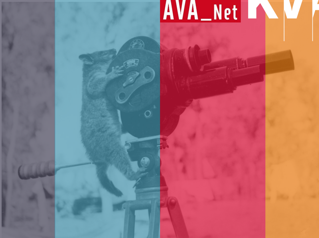
A possum and a movie camera 1943