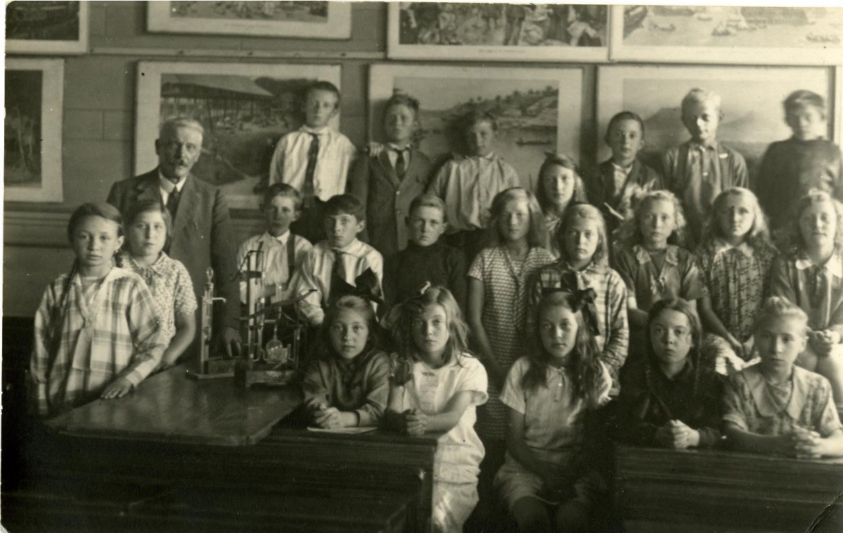
Afbeelding. Klassenfoto van de Openbare Lagere School te Pijnacker (1920). Maker onbekend. Publiek Domein.

Kunnen klassenfoto's van diverse scholen uit de periode 1880-heden online worden geplaatst?