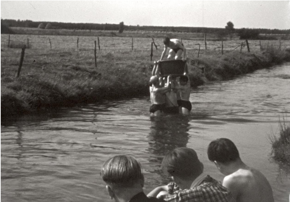
Afbeelding. Screenshot film Stichting Sint Hieronymus

Het Haags Gemeentearchief beheert een reeks filmpjes van de Stichting Sint Hieronymus. In deze film wordt gedocumenteerd dat paters uit Den Haag op vakantie gaan met een groep jongens. In de films is te zien dat zij samen fietsen, zwemmen, eten, bidden en gaan slapen. De films zijn uit de jaren 50 van de vorige eeuw.